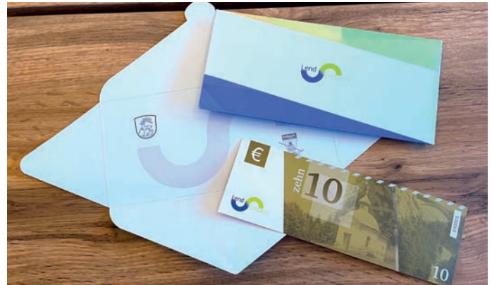
Unser „LEZ“ - (LendEmbachZehner)