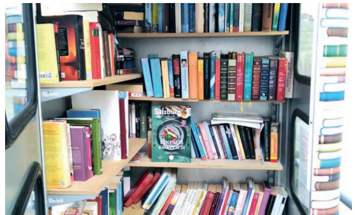
Unsere Bücherzelle in Embach

Ein Projekt von uns allen war die erste Bücherzelle in Embach. Wie uns Bürger informiert haben, wird dieses Projekt extrem gut angenommen. Derzeit wird eine Bücherzelle in Oberlend aufgestellt und wir wollen dieses Projekt auch ausweiten mit einer Spielezelle und vielem mehr.