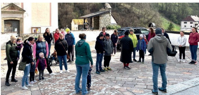
Ostereiersuche in Lend

Zu Ostern wurde in Embach und Lend ein Ostereiersuchspiel veranstaltet, sehr zur Freude aller Beteiligten. Ca. 160 Eier konnten von den Kindern entdeckt werden.