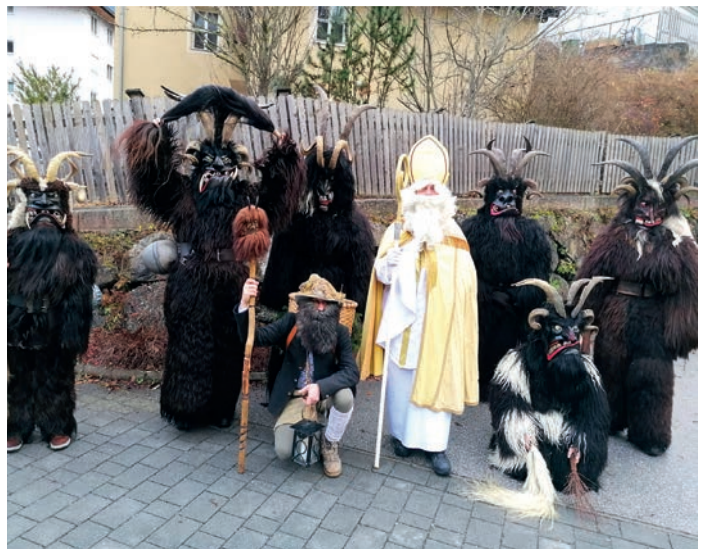
Krampus Pass des Trachtenvereins Klammstoana

Auf diesem Wege wünsche ich euch ALLEN schöne, friedliche und gesunde Weihnachten und einen guten Rutsch ins neue Jahr 2023!