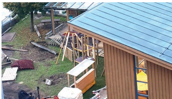
Im Außen- und Innenbereich wurde heuer in den Kindergärten investiert

Die Außenbereiche wurden neu gestaltet. Die Innenbereiche wurden komplett ausgemalt und erneuert.