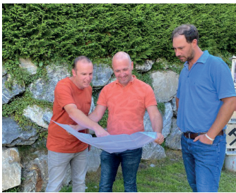
Gemeindevertreter beim Ideen sammeln