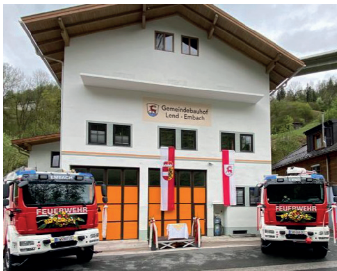
Unser neuer Bauhof sowie unsere neuen Tankfahrzeuge bei der Einweihungsfeier am 1. Mai

Der neue Bauhof Lend-Embach konnte fertig gestellt werden und wurde am 1. Mai mit einem großen Einweihungsfest in Betrieb genommen.