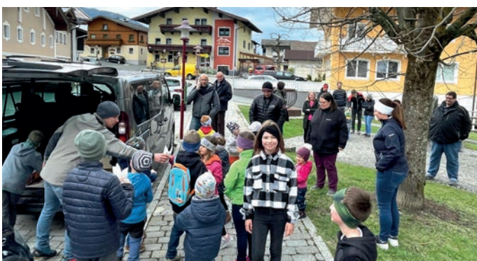
Ostereiersuche in Embach