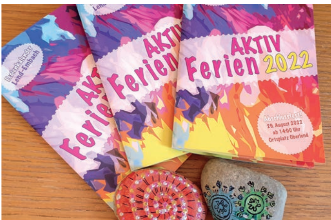
FerienAKTIV Broschüre 2022

Unser Projekt „FerienAKTIV“ ist von einer netten Ferienbeschäftigung 2015 zu einem ausgedehnten Kinder- und Ferienprogramm für unseren Nachwuchs geworden. Heuer konnten 44 Veranstaltungen angeboten werden.