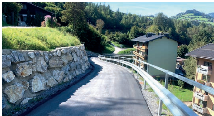
nach jahrelangem Tauziehen endlich fertiggestellt - Gigerachstraße

Der Straßenbau in Gigerach konnte fertig gestellt werden, es kommen jedoch in Zukunft noch einige recht kostenintensive Straßenprojekte auf die Gemeinde zu, die wir in naher Zukunft angehen werden.