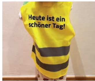
Neue Warnwesten zum Schulstart